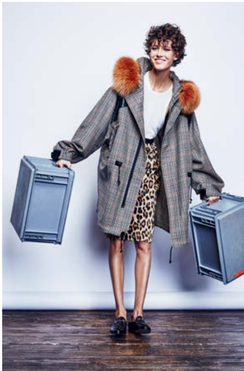
На Алёше: Майка Rosetta Getty 24 050 руб. Юбка Altuzarra 257 500 руб. Пальто Rodarte 499 500 руб. Лоуферы Gucci 47 050 руб.