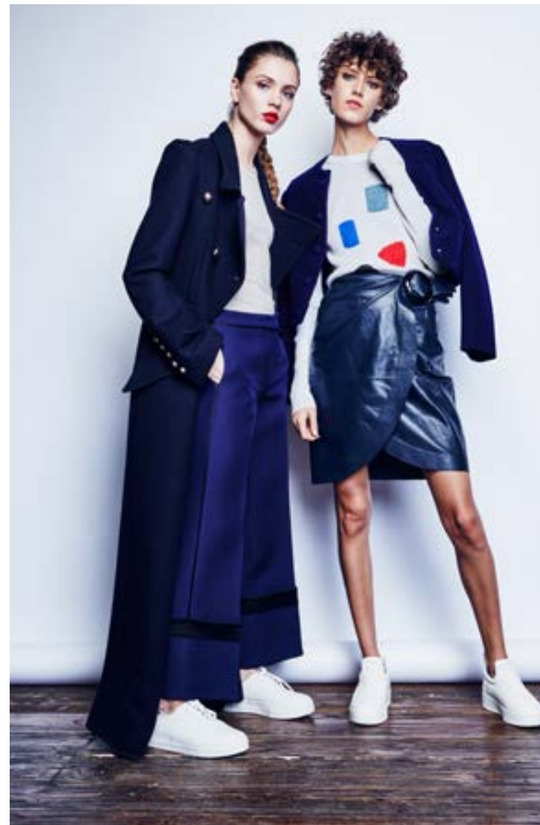
На Юле: Майка Rick Owens 16 200 руб. Брюки Derek Lam 85 400 руб. Пальто Chloé 396 000 руб. Кроссовки Eytys 17 050 руб.