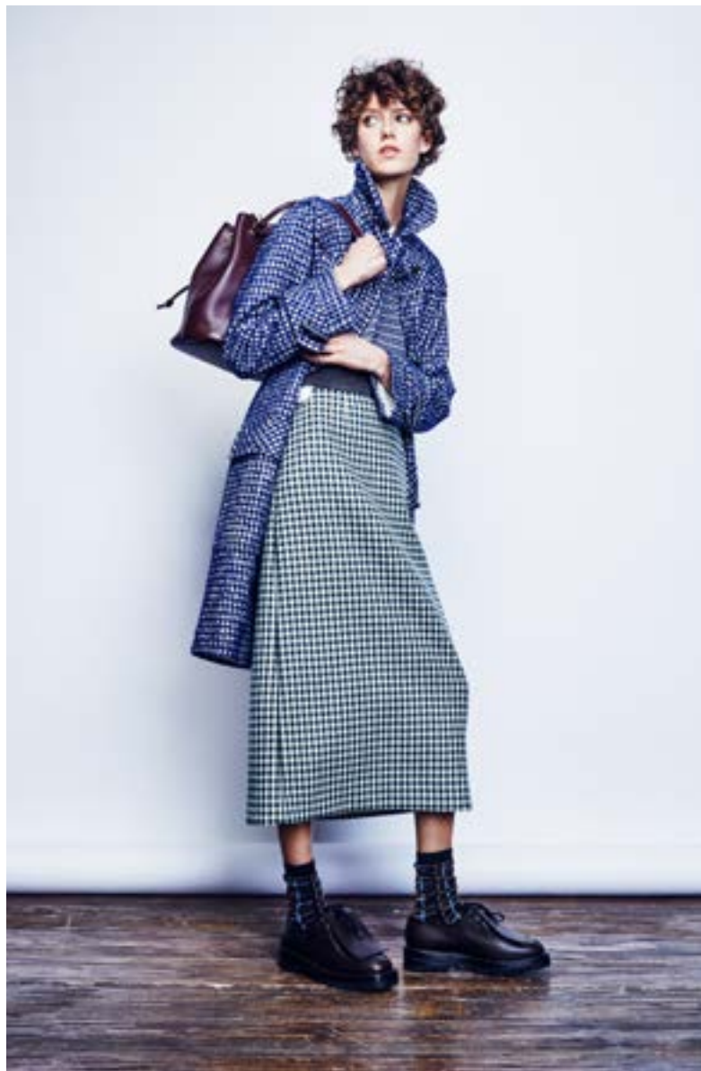
На Алёше: Футболка Haider Ackermann 29 100 руб. Жилет Marni 64 900 руб. Юбка Mother of Pearl 45 800 руб. Пальто Bottega Veneta 262 500 руб. Носки Marni 6 295 руб., ботинки Marni 48 800 руб. Рюкзак Saint Laurent 157 000 руб.