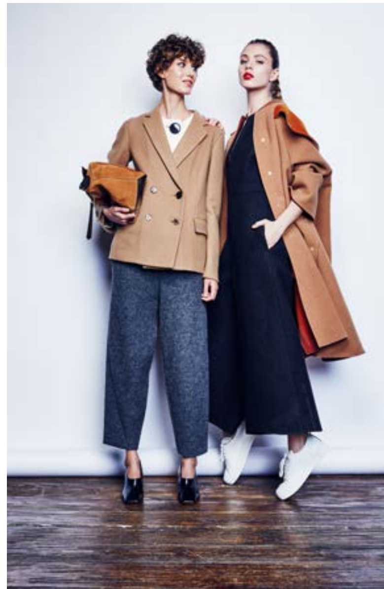
На Алёше: Блуза Balenciaga 108 000 руб. Брюки Stella McCartney 49 950 руб. Жакет Céline 296 500 руб. Туфли Céline 53 950 руб. Сумка Loewe 167 500 руб.