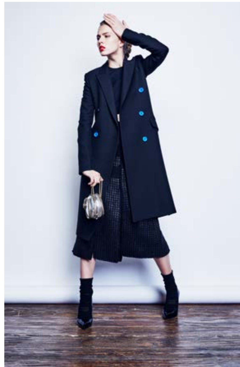
На Юле: Пуловер Proenza Schouler 49 800 руб. Юбка Proenza Schouler 99 600 руб. Пальто Proenza Schouler 92 400 руб. Туфли Alexander McQueen 63 100 руб. Сумка Roberto Cavalli 165 500 руб.