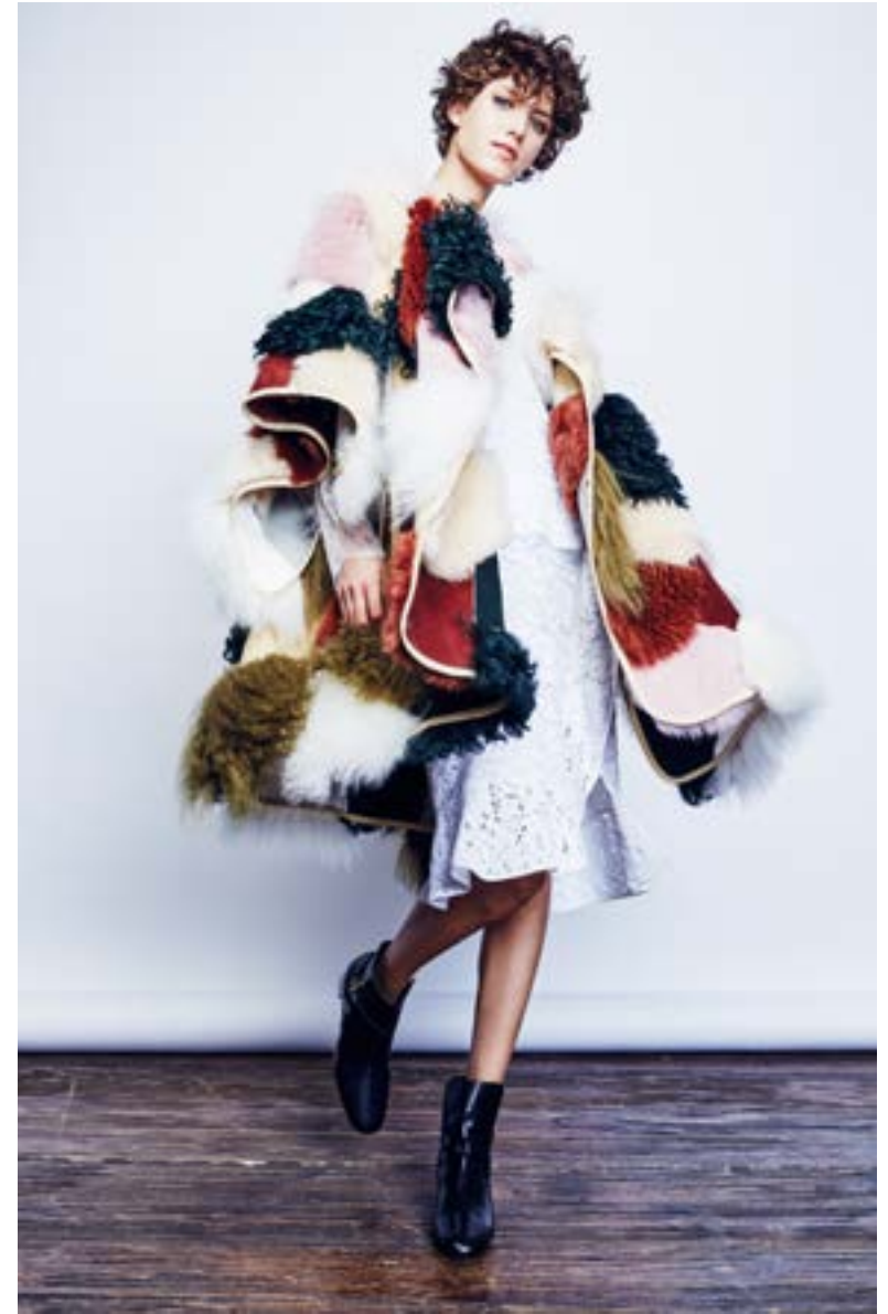
На Алёше: Платье Altuzarra 180 500 руб. Пальто Chloé 958 500 руб. Ботильоны Tom Ford 87 250 руб.