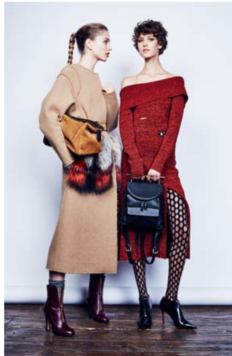
На Юле: Пальто Marni 399 500 руб. Ремень Marni 15 750 руб. Носки Dore Dore 2 765 руб. Полусапоги Valentino Garavani 84 800 руб. Сумка Loewe 167 500 руб.