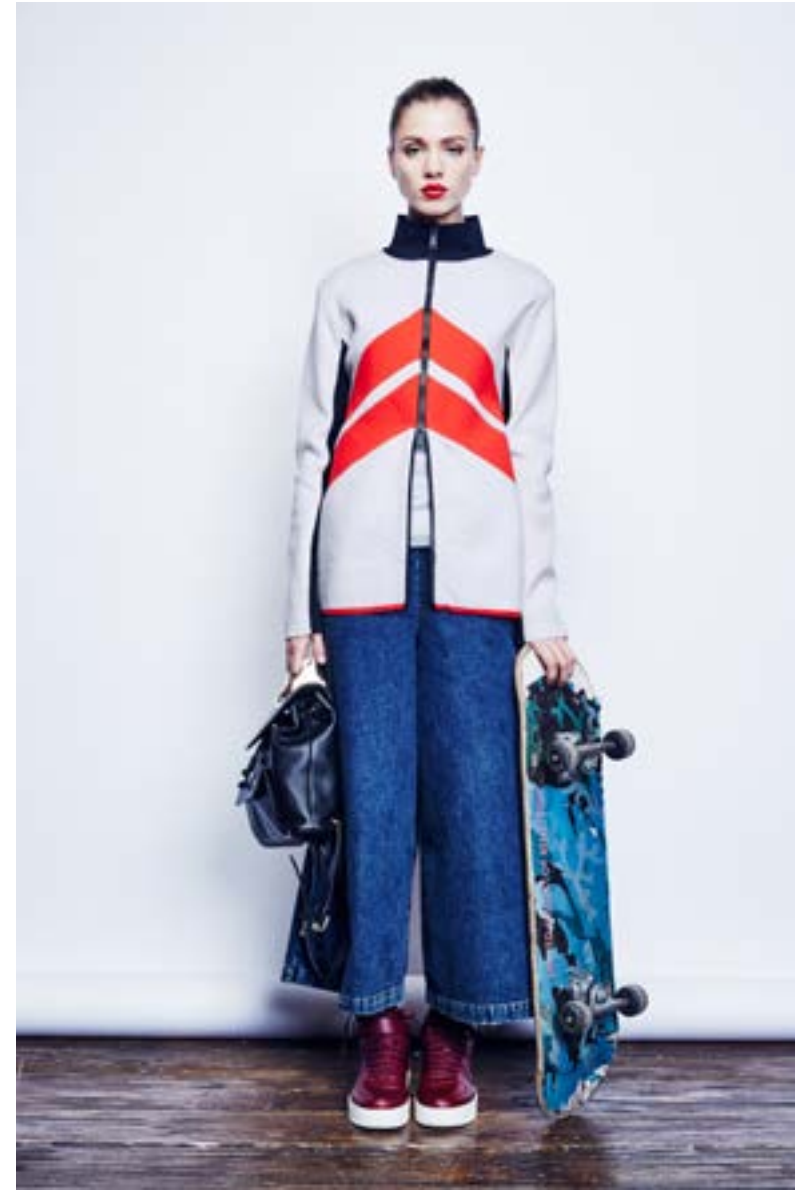
На Юле: Майка Haider Ackermann 23 950 руб. Кардиган Paco Rabanne 145 000 руб. Брюки Rachel Comey 35 250 руб. Кроссовки Céline 57 250 руб. Рюкзак M2Malletier 108 000 руб.