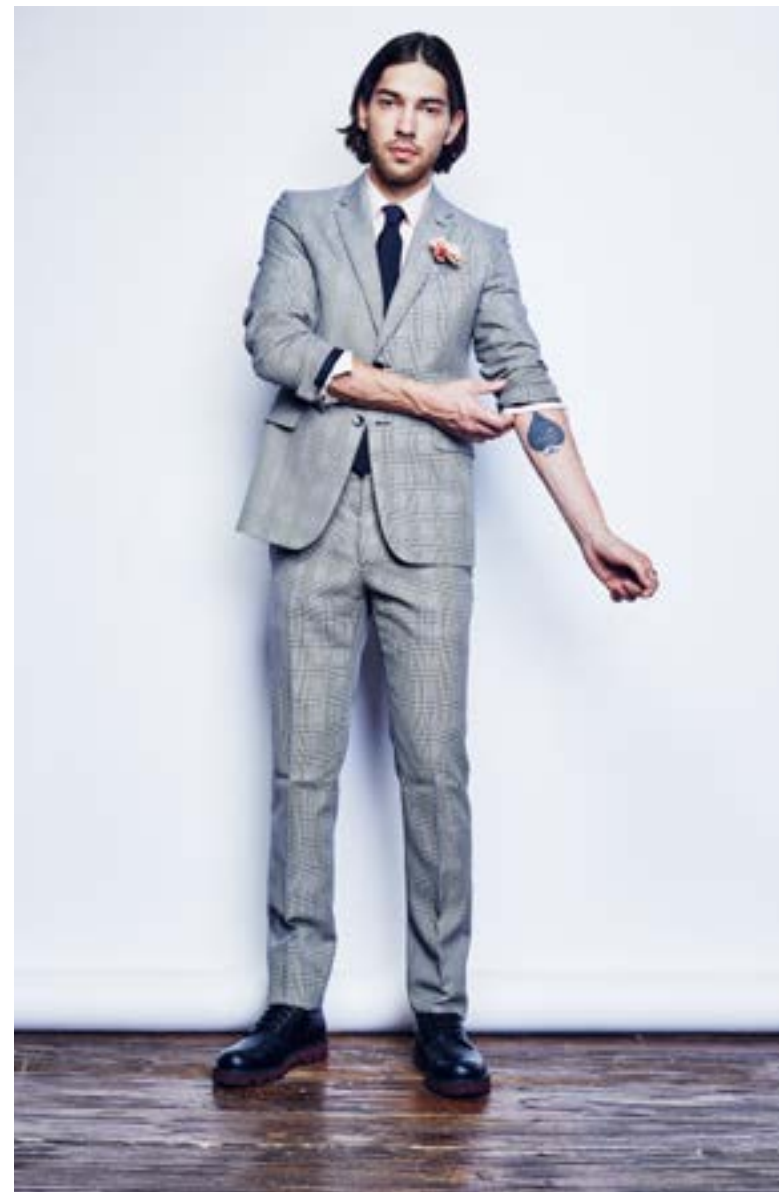
На Вадиме: Рубашка Burberry Brit 14 350 руб. Галстук Dolce & Gabbana 14 250 руб. Костюм Valentino 210 500 руб. Туфли Valentino Garavani 47 250 руб.