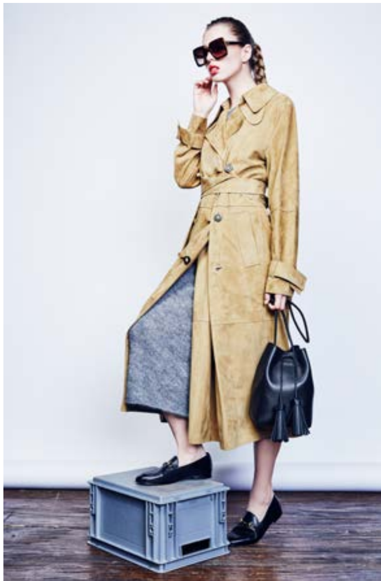
На Юле: Очки Dolce & Gabbana 10 500 руб. Платье Michael Kors 47 950 руб. Плащ Loewe 438 000 руб. Лоуферы Gucci 47 050 руб. Сумка Tom Ford 131 000 руб.