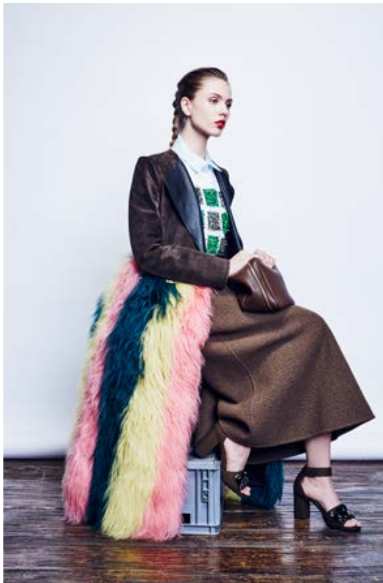
На Юле: Блуза Delpozo 163 000 руб. Юбка Rochas 295 000 руб. Пальто Marni 661 000 руб. Босоножки Marni 44 800 руб. Сумка Mark Cross 151 500 руб.