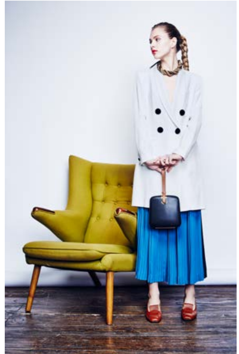
На Юле: Жакет Adam Lippes 143 000 руб. Юбка Loewe 111 500 руб. Колье Lanvin 72 950 руб. Туфли Charlotte Olympia 45 250 руб. Клатч Marni 89 650 руб.