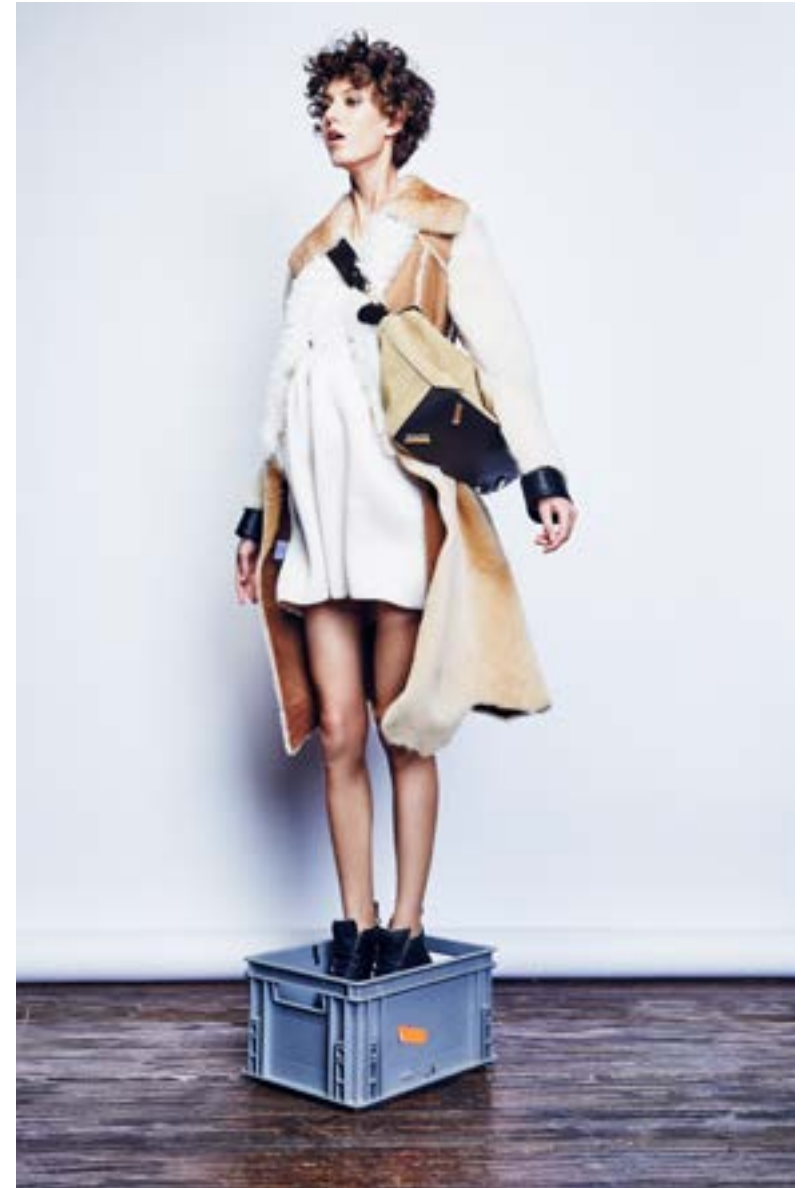
На Алёше: Платье Calvin Klein 96 350 руб. Дубленка Calvin Klein 347 500 руб. Кеды Eytys 22 400 руб. Сумка Loewe 151 500 руб.