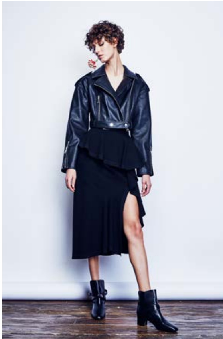
На Алёше: Боди Maison Margiela 25 950 руб. Юбка Givenchy 182 000 руб. Куртка Vika Gazinskaya 74 520 руб. Ботильоны Tom Ford 87 250 руб.