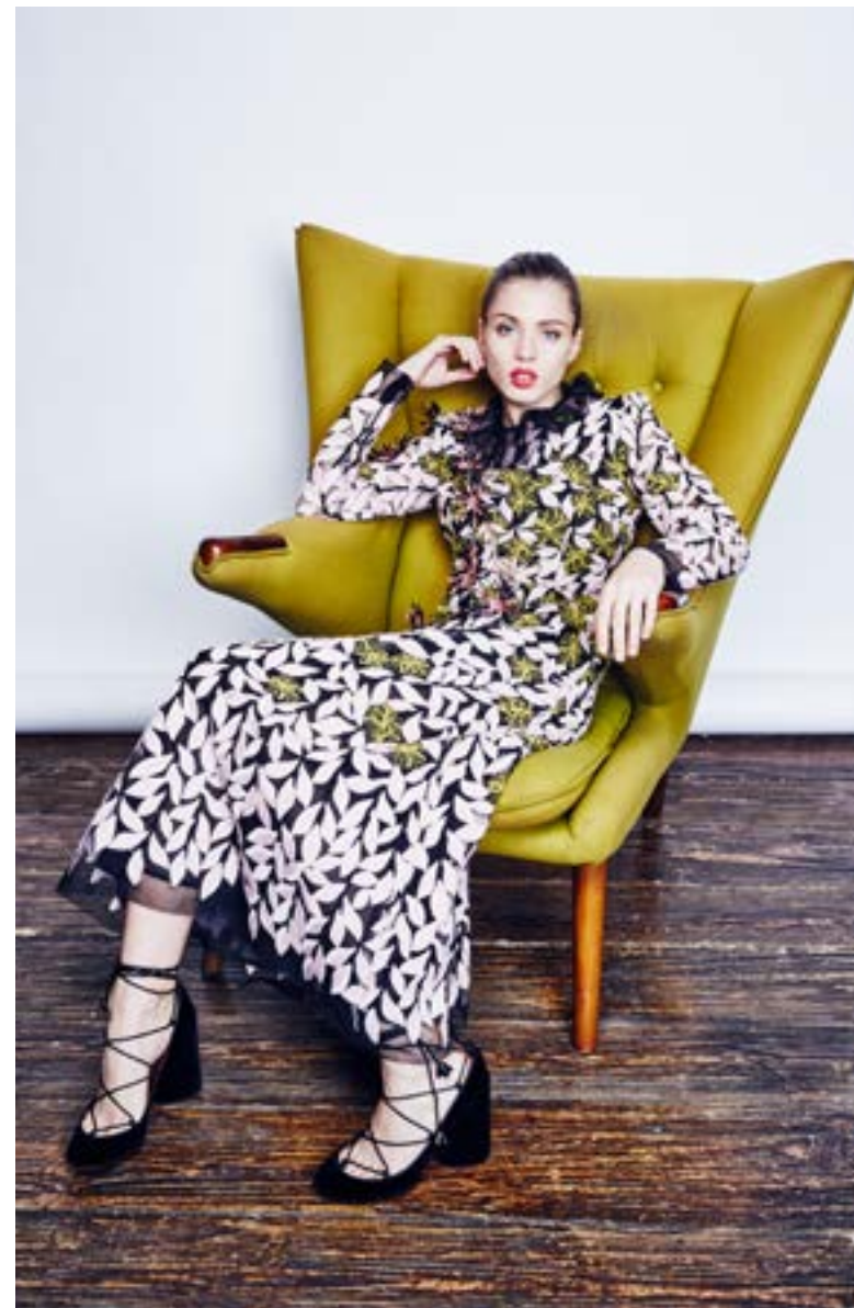
На Юле: Платье Giambattista Valli 780 500 руб. Туфли Marc Jacobs 49 100 руб.