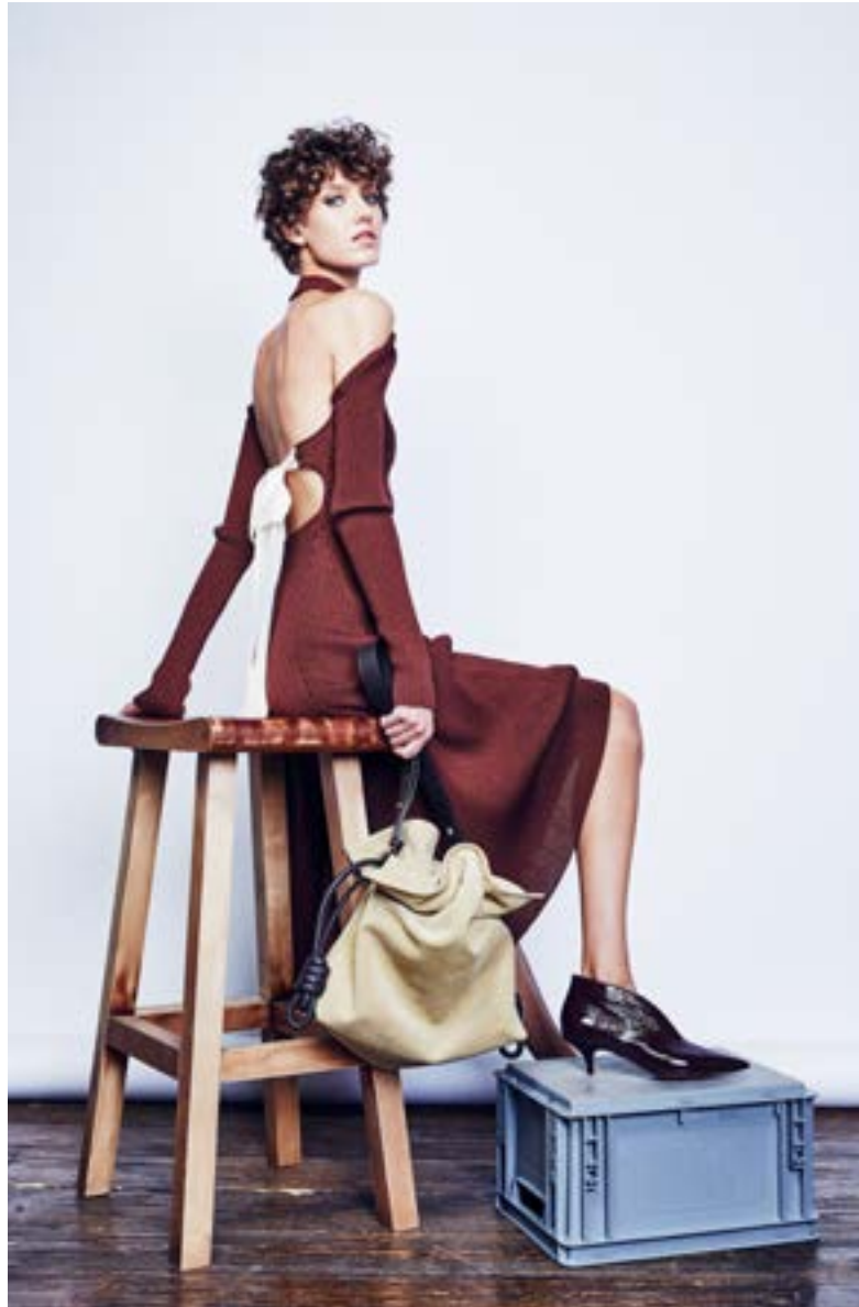
На Алёше: Платье Céline 205 000 руб. Ботильоны Céline 51 450 руб. Сумка Loewe 151 500 руб.