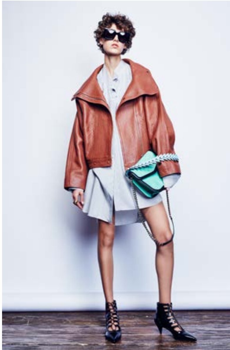
На Алёше: Очки Céline 18 180 руб. Блуза Loewe 119 500 руб. Куртка Loewe 279 000 руб. Ботильоны Saint Laurent 85 550 руб. Сумка Loewe 151 500 руб. Кольцо Chloé 28 750 руб.