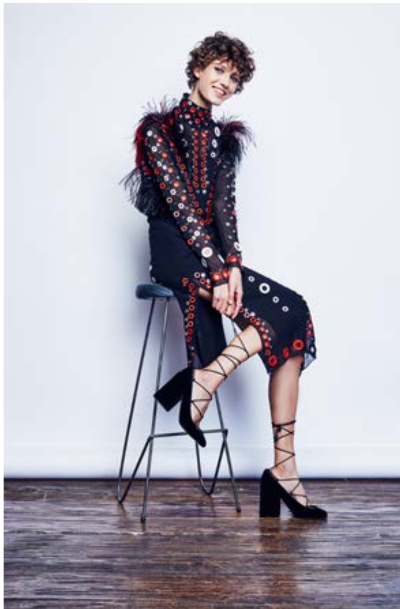
На Алёше: Платье Proenza Schouler 799 500 руб. Туфли Marc Jacobs 49 100 руб.