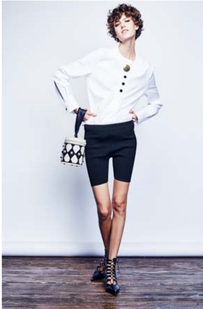
На Алёше: Блуза Balenciaga 59 150 руб. Шорты Paco Rabanne 46 550 руб. Ботильоны Saint Laurent 85 550 руб. Сумка Olympia Le-Tan 99 500 руб.