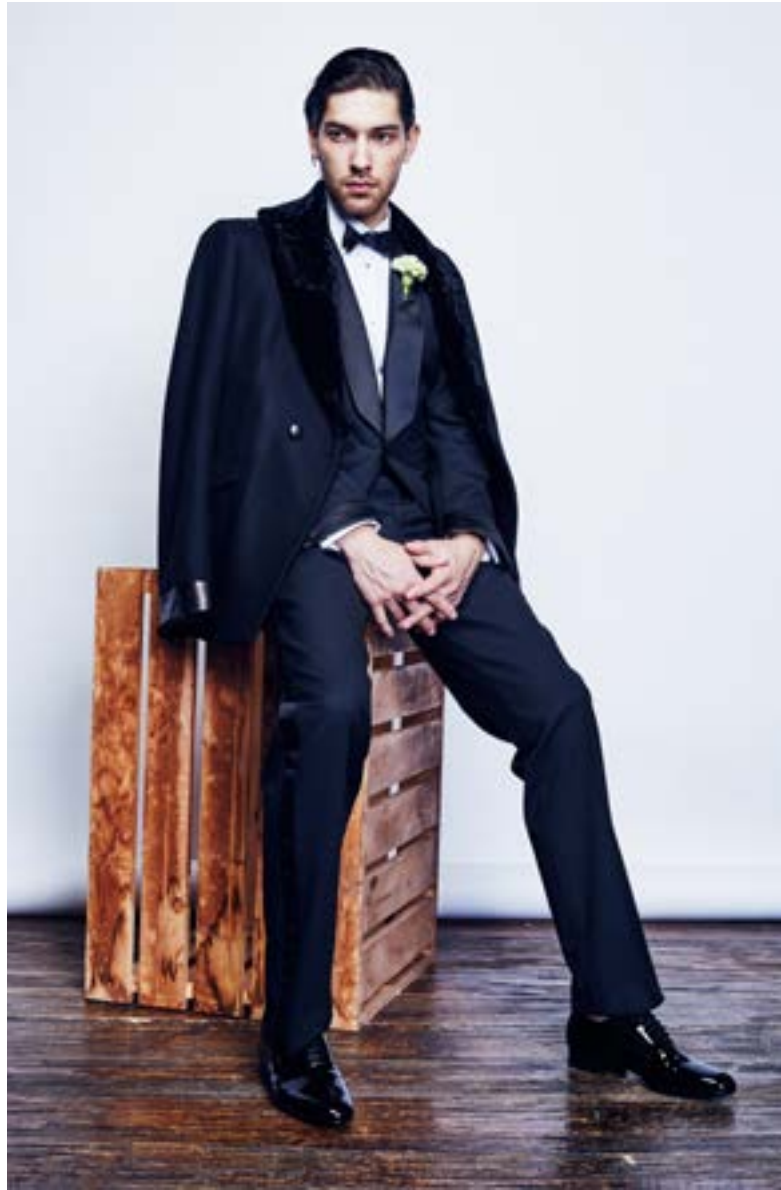
На Вадиме: Сорочка Dolce & Gabbana 62 150 руб. Галстук-бабочка Saint Laurent 8 900 руб. Смокинг Tom Ford 348 000 руб. Пиджак Roberto Cavalli 153 500 руб. Пояс для смокинга Dolce & Gabbana 45 050 руб. Туфли Saint Laurent 49 800 руб.