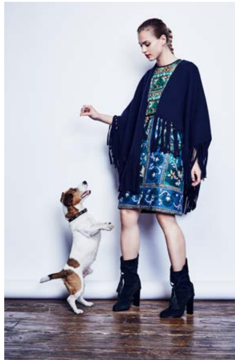
На Юле: Платье Burberry Prorsum 396 000 руб. Пончо Burberry Prorsum 126 000 руб. Полусапоги Lanvin 89 950 руб.