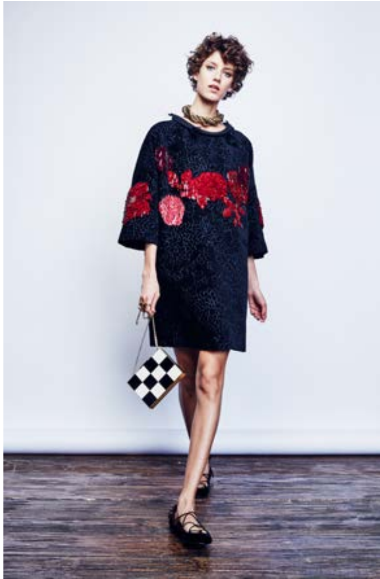
На Алёше: Платье Lanvin 388 000 руб. Колье Lanvin 72 950 руб. Балетки Marc Jacobs 44 350 руб. Клатч Valentino Garavani 167 000 руб.