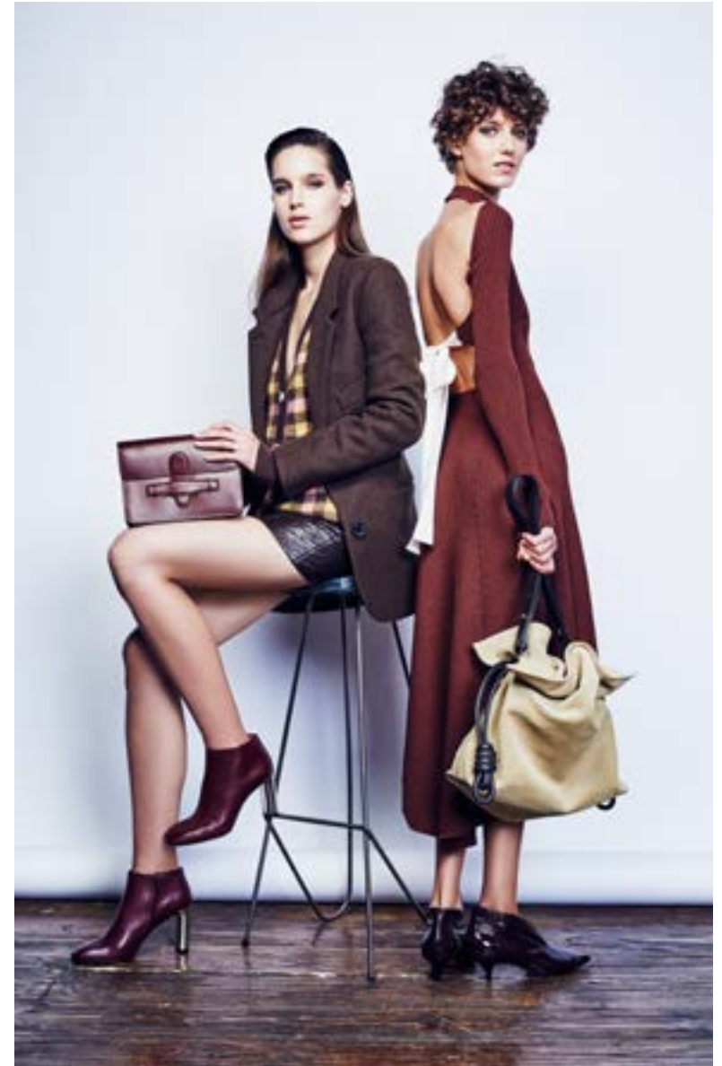
На Насте: Жакет Christophe Lemaire 76 600 руб. Кардиган Marc Jacobs 137 500 руб. Юбка Mary Katrantzou 199 500 руб. Ботильоны Céline 66 400 руб. Сумка Céline 114 000 руб.