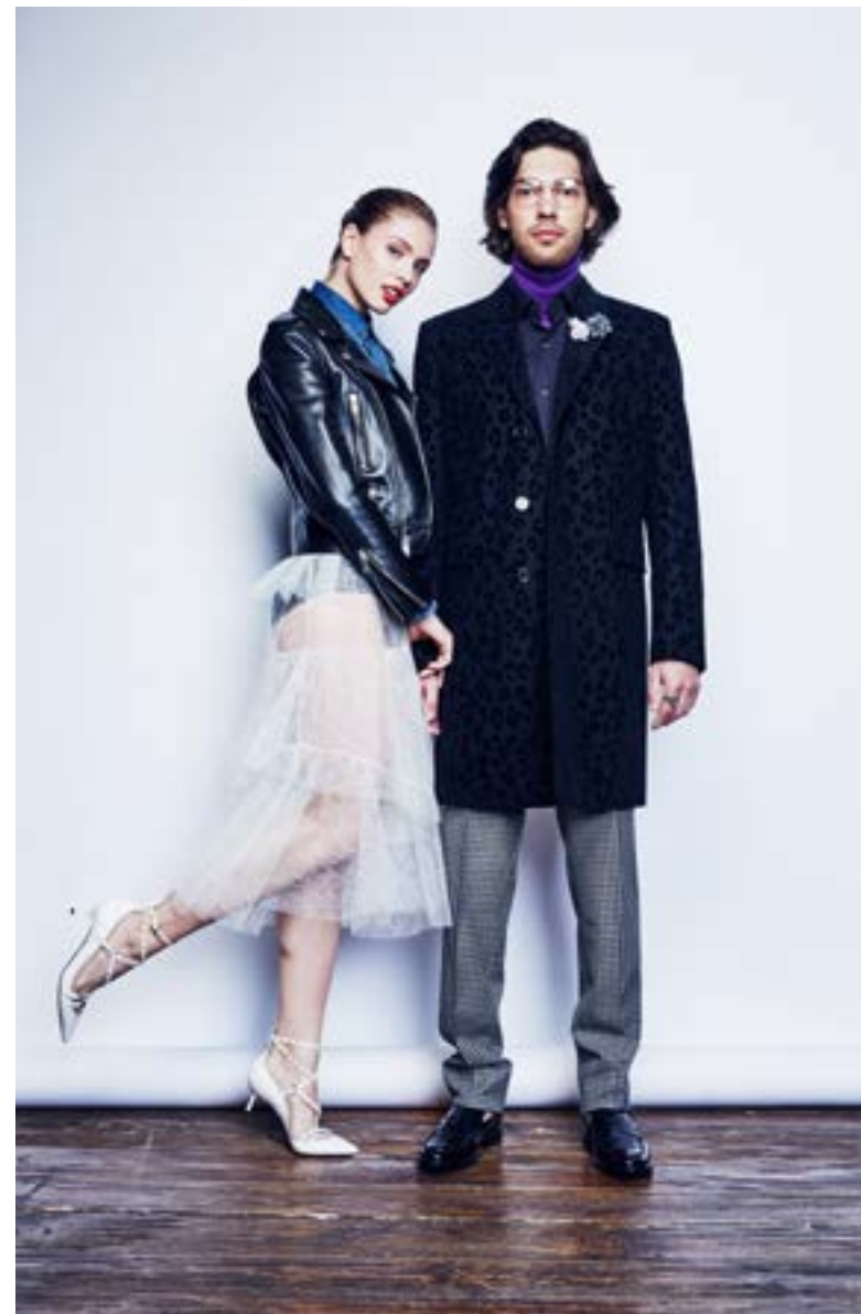
На Юле: Блуза Saint Laurent 64 200 руб. Жакет Saint Laurent 417 500 руб. Трусы Chantelle 5 240 руб. Юбка Walk of Shame 36 450 руб. Туфли Valentino Garavani 61 700 руб.