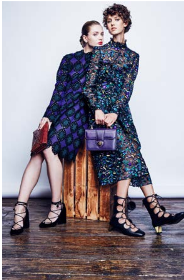
На Юле: Платье Erdem 278 000 руб. Туфли Marc Jacobs 49 100 руб. Клатч Bottega Veneta 668 000 руб.