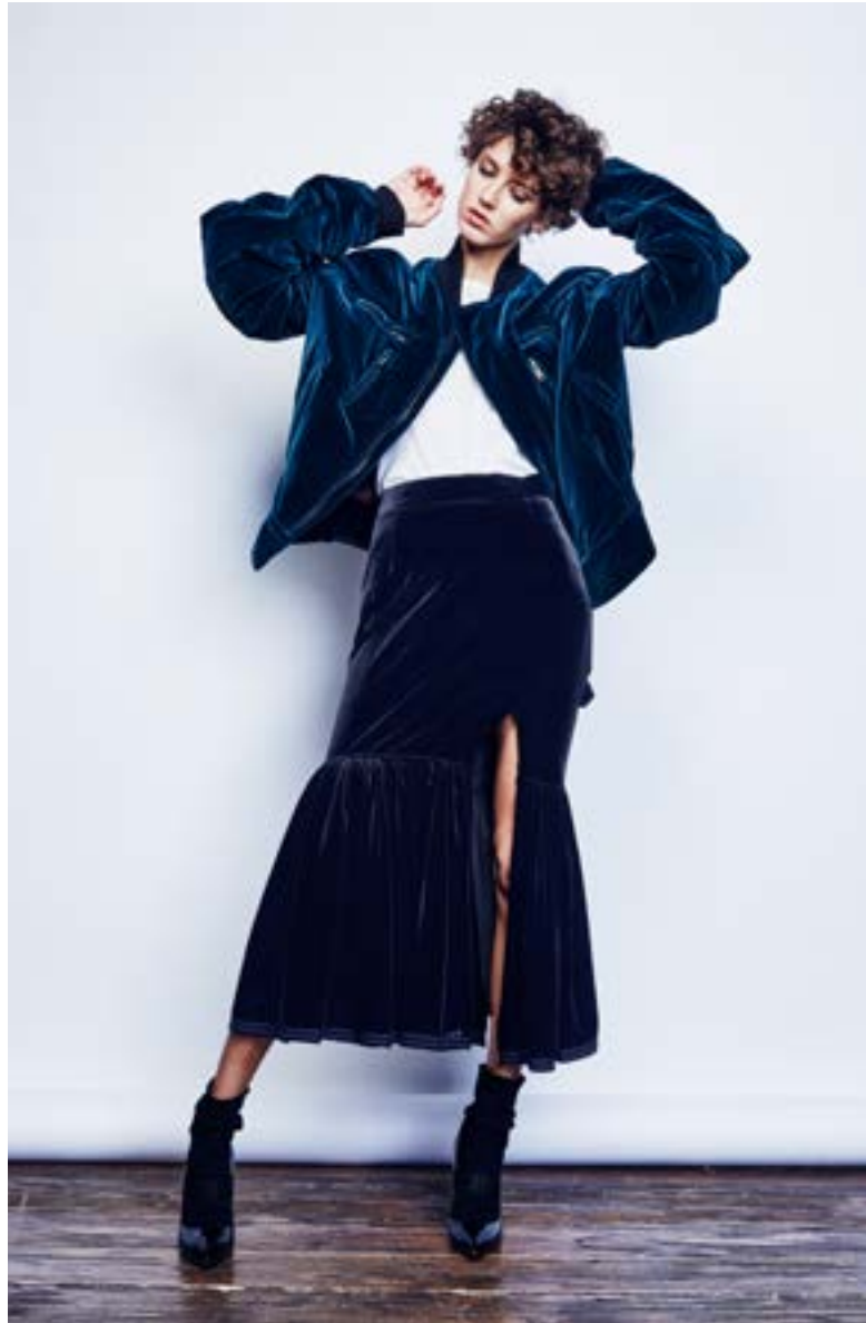
На Алёше: Футболка Haider Ackermann 29 100 руб. Юбка Givenchy 170 500 руб. Куртка Haider Ackermann 155 500 руб. Туфли Alexander McQueen 63 100 руб.