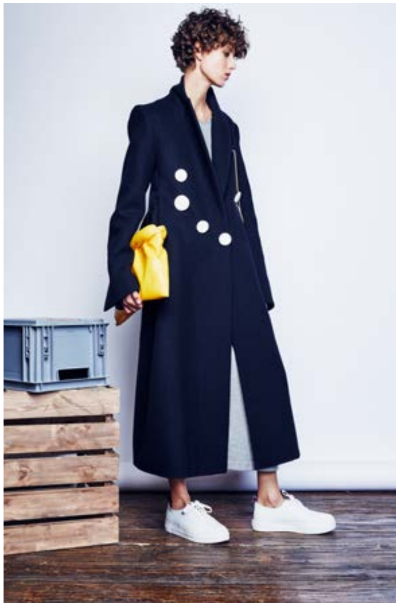
На Алёше: Платье Ralph Lauren 128 000 руб. Пальто Ellery 184 000 руб. Кеды Eytys 17 050 руб. Клатч Céline 93 000 руб.